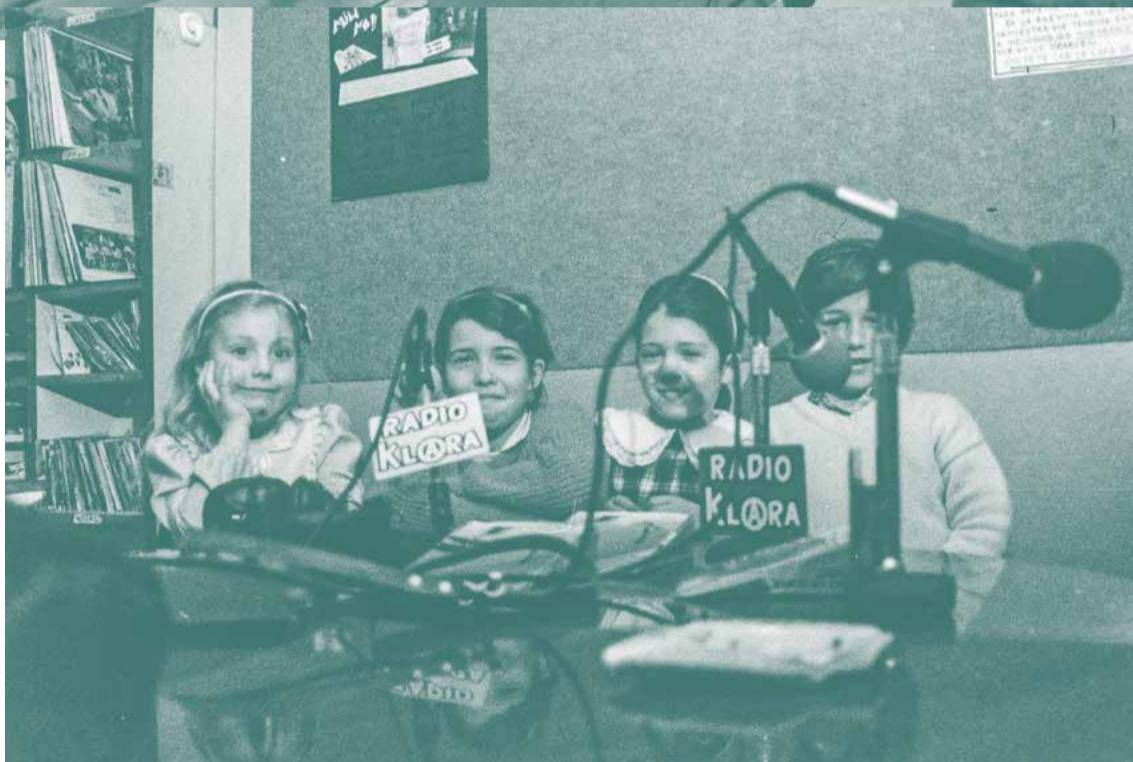
RÀDIO KLARA / L'estudi de Ràdio Klara als seus inicis